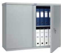
АМ 0891/М 08